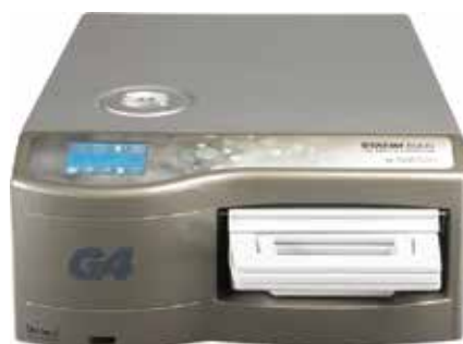
ステイティム 5000G4 定価 1,350,000円