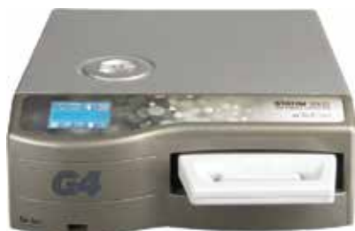
ステイティム 2000G4 定価 850,000円