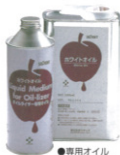
●専用オイル NET.500ml NET.1000ml